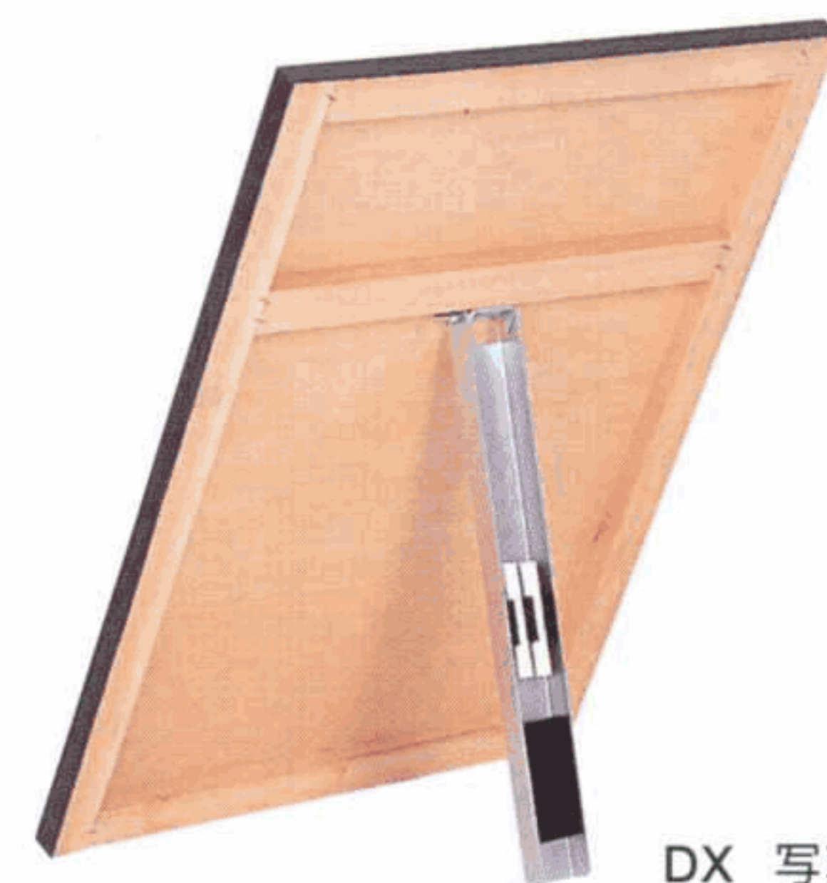
DX 写真板用スタンド(別売)